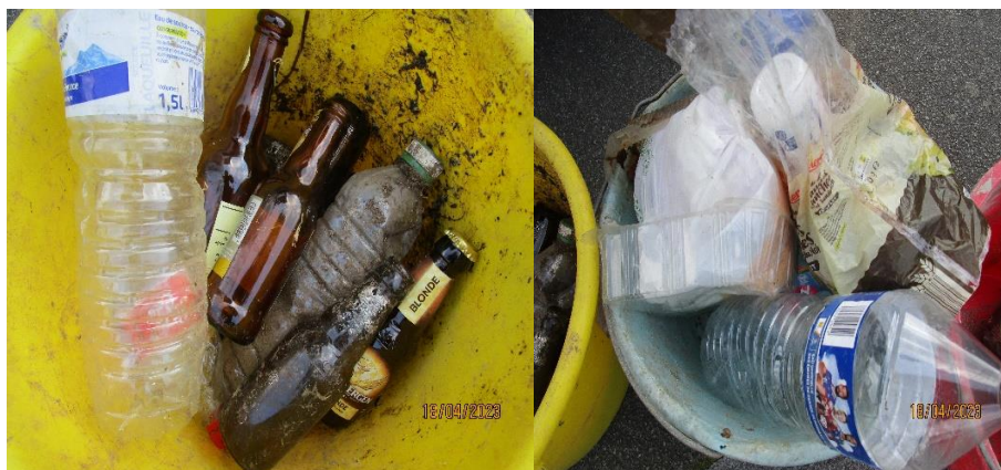
Déchets ramassés lors d'un « plogging » sur notre commune...

La propreté d'un lieu ne dépend pas du travail des agents communaux mais de la civilité, du savoir vivre ensemble, des gens qui pratiquent ces lieux