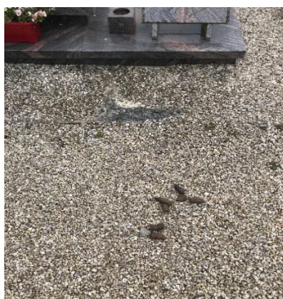
Rappel : le cimetière est interdit aux chiens.